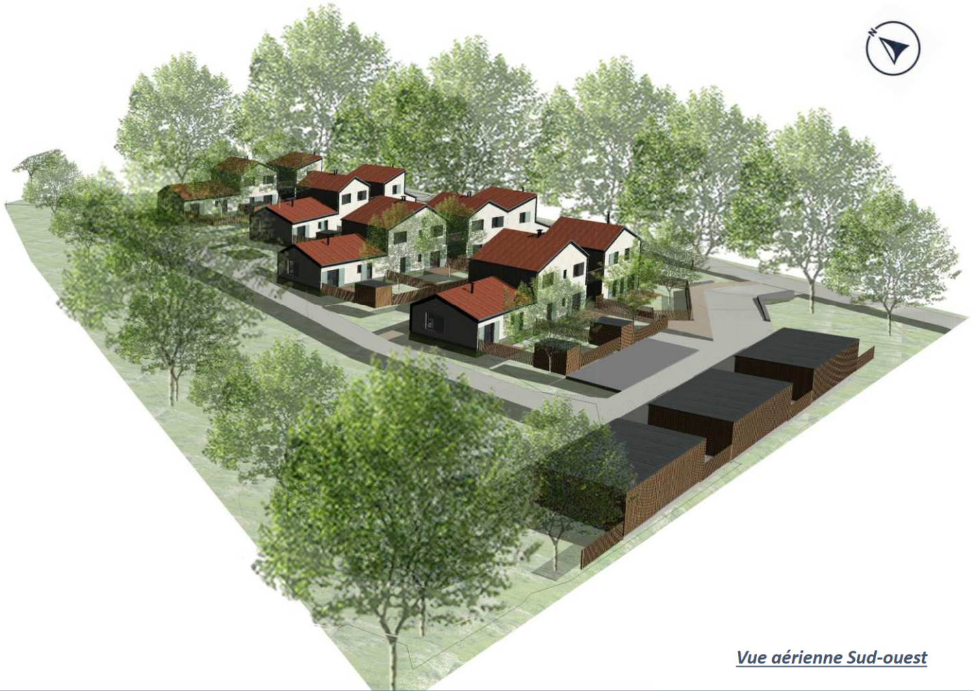
Vue aérienne Sud-ouest